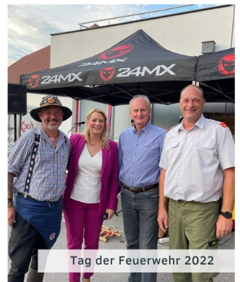
Tag der Feuerwehr 2022