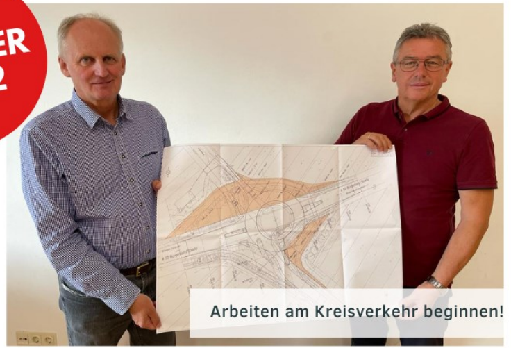
Arbeiten am Kreisverkehr beginnen!