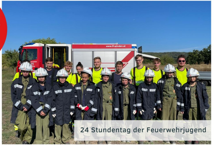
24 Stundentag der Feuerwehrjugend