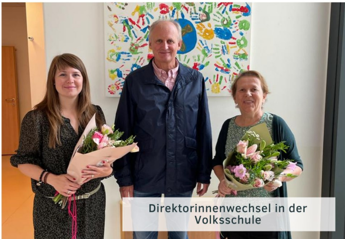
Direktorinnenwechsel in der Volksschule