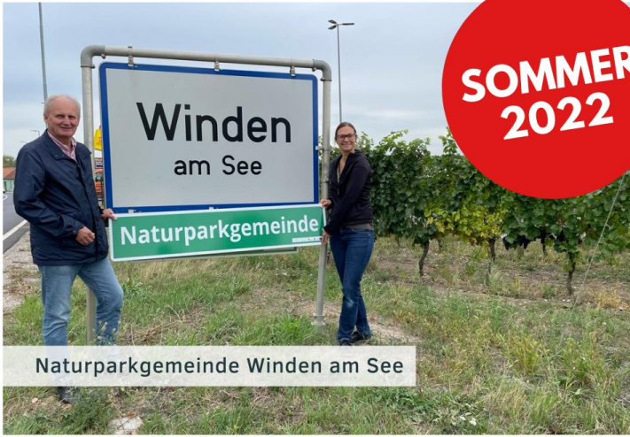
Naturparkgemeinde Winden am See