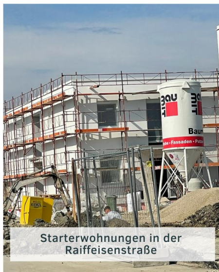
Starterwohnungen in der Raiffeisenstraße