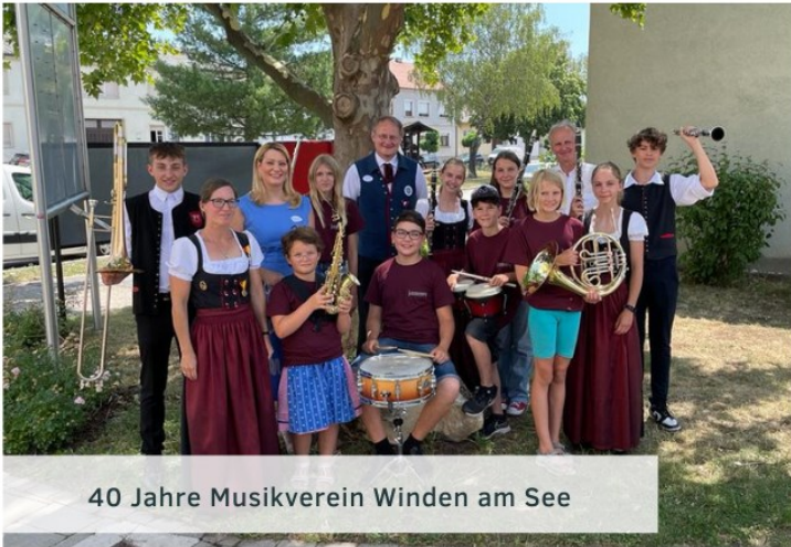
40 Jahre Musikverein Winden am See