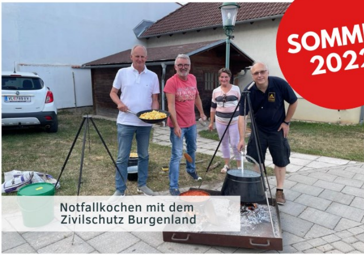
Notfallkochen mit dem Zivilschutz Burgenland