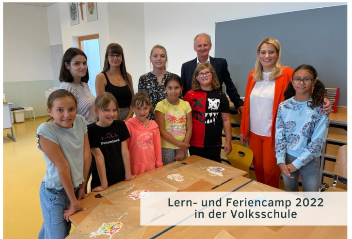
Lern- und Feriencamp 2022 in der Volksschule