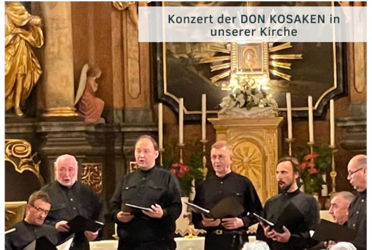
Konzert der DON KOSAKEN in unserer Kirche