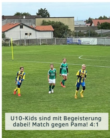
U10-Kids sind mit Begeisterung dabei! Match gegen Pama! 4:1