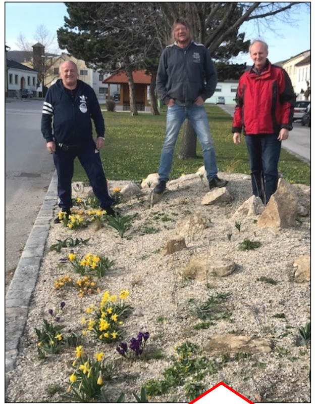
Bei den schön angelegten Blumeninseln zeigen sich bereits Frühlingsblüher wie Narzissen, Tulpen und Krokusse in voller Blüte.