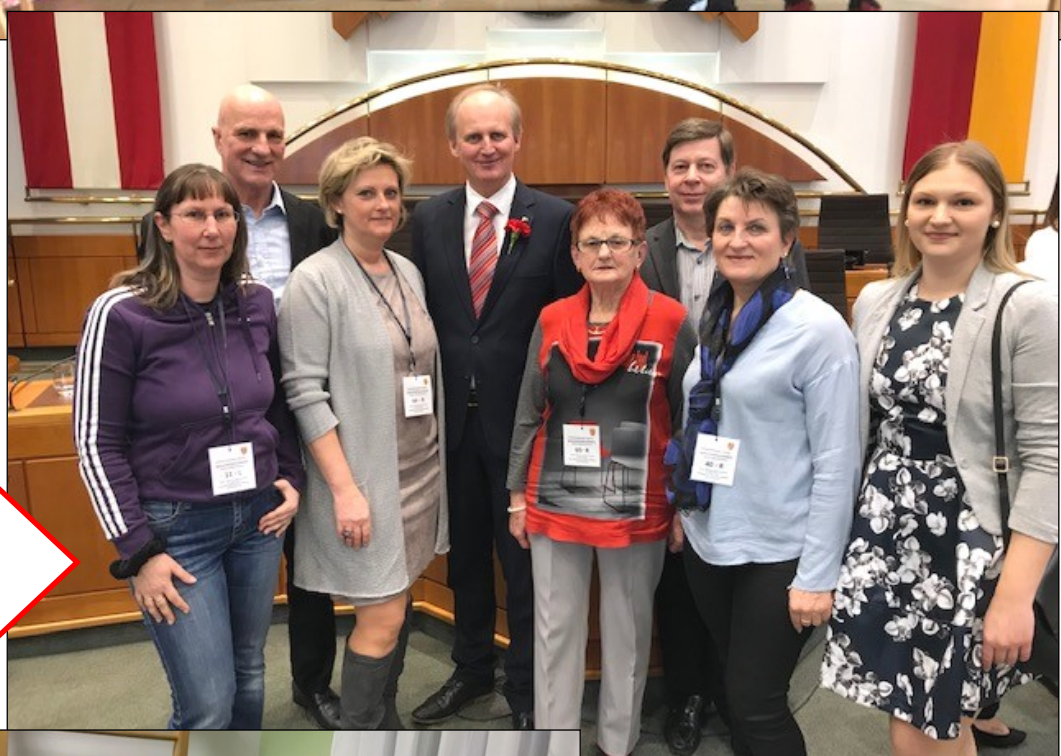
Angelobung von Bgm. Erwin Preiner zum Landtagsabgeordneten in der Burgenländischen Landesregierung