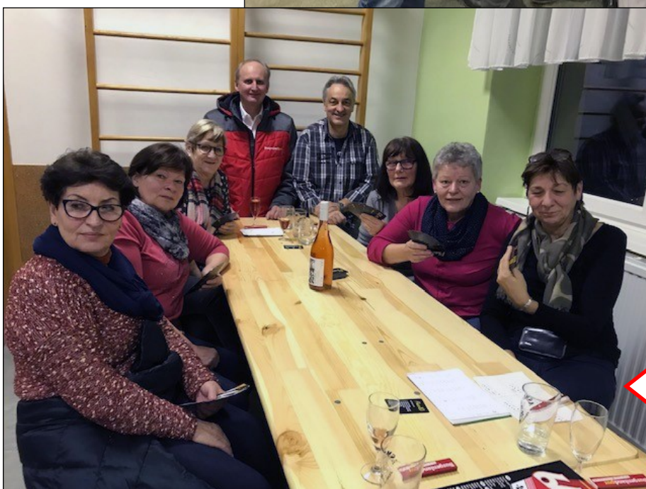
Pensionistennachmittag im ehemaligen Kindergarten