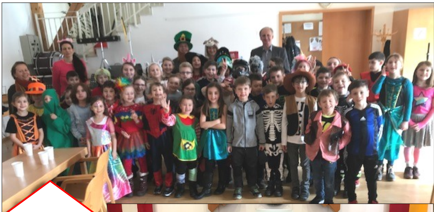
Besuch der Volksschulkinder am Faschingsdienstag im Vereins- und Kulturhaus